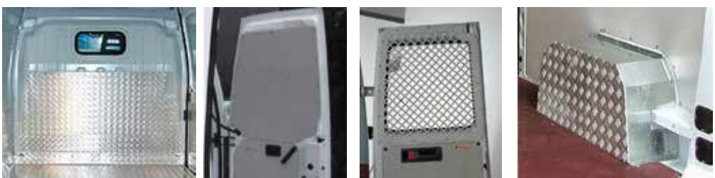
Schutzplatte für Fahrer - Rückwand Türverkleidungen Gitter für Fenster Radkastenverkleidung

Sämtliche Innenverkleidungen werden vorgeschnitten und vorgebohrt geliefert und sind somit sofort einbaufähig!