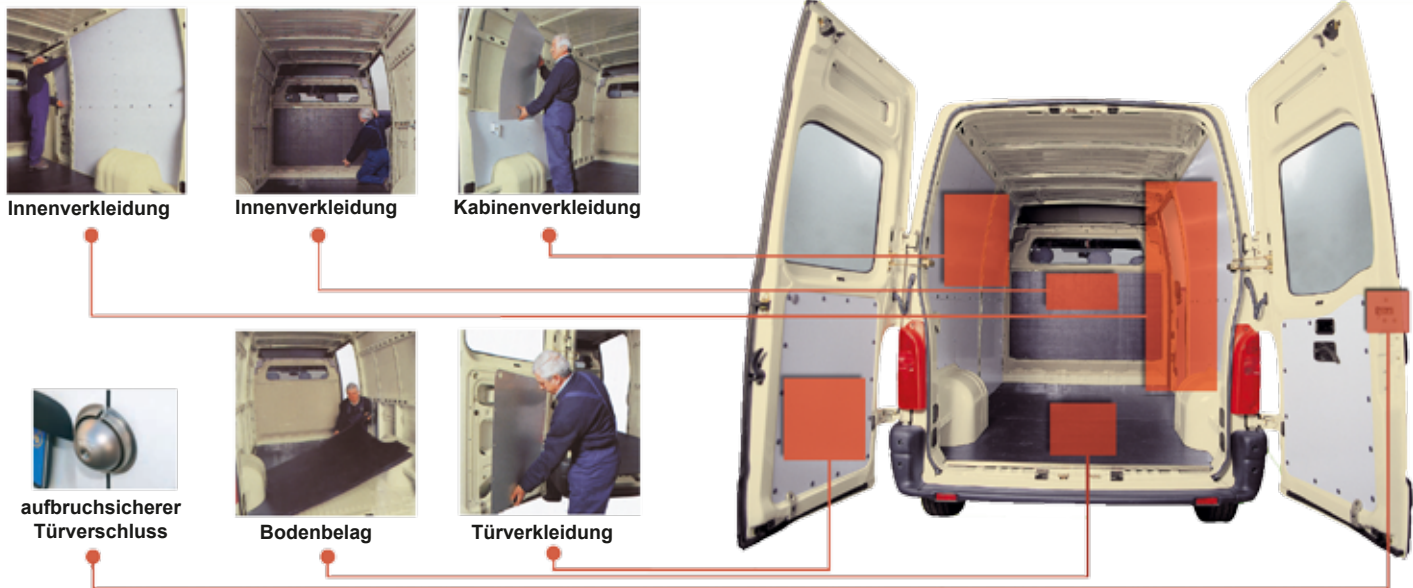
Innenverkleidung Innenverkleidung Kabinenverkleidung

Schubladen mit neu gestaltetem Griffmulden und zweifachen Verschlüssen; glatte, ebene Front; maximale Sicherheit